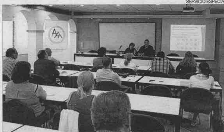
►► Un momento de la charla ofrecida por Plena Inclusión a los aparejadores.

En primer lugar, se explicó a los asistentes qué es la discapacidad intelectual.