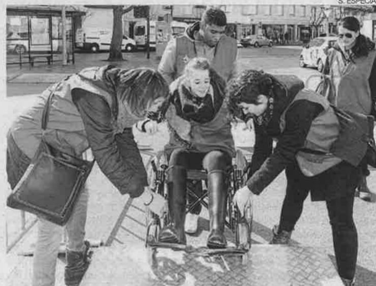
►► Una yincana de sensibilización celebrada en Huesca.

Con este proyecto se pretende conseguir avances significativos en la inclusión de las personas con discapacidad y/o dependencia, con el fin de llegar a calificar a Huesca como ciudad inclusiva. Se trabaja en distintos ámbitos de actuación como en la accesibilidad universal, la participación social, el voluntariado, el apoyo al movimiento asociativo, el apoyo a familias, el empleo, la vivienda, la educación inclusiva y el apoyo a los servicios.