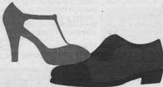
►► Imagen del cartel de la obra 'La venganza de la Petra'.

dudado en volver a subirse al escenario para representar esta comedia basada en la obra que Carlos Arniches, considerado como el mejor intérprete de la vida y costumbres madrileñas, estrenó en 1917.